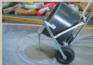
Karre zum Transport und zum Ausgießen

Eine Epoxidharzexposition kann unterschiedliche Folgen haben: am häufigsten sind Reizungen und Allergien der Haut. Sollte es zu einer Sensibilisierung, d.h.