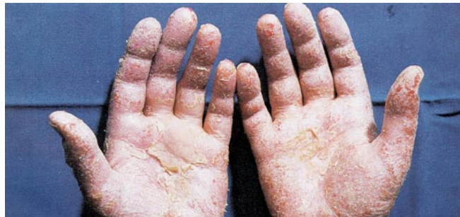
Allergische Hautreaktion durch Epoxidharze

Das Einatmen von Lösemitteldämpfen kann zu Kopfschmerzen führen und auch andere Teile Ihres Körpers schädigen (z. B. das Nervensystem).